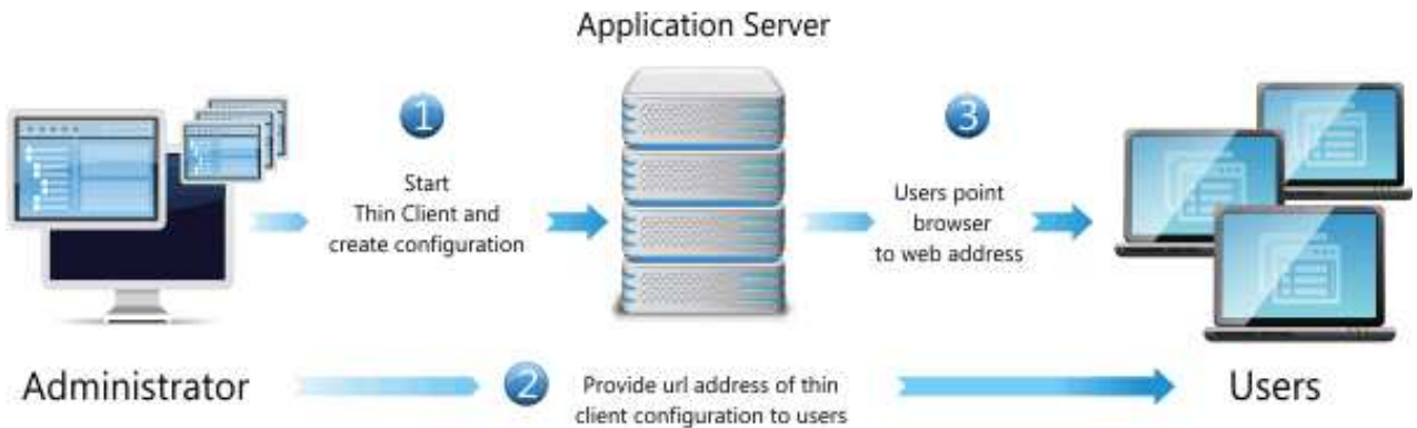
圖 1. 使用 QMF for WebSphere 為多位使用者配置 QMF